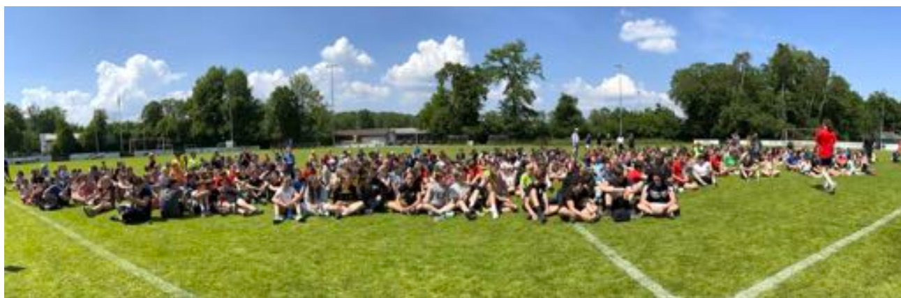
Rangverkündigung Sporttag 2023