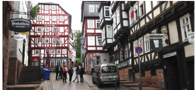
Marburg - Aarberg