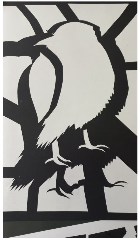
Schülerarbeit zu Krabat

Wir freuen uns auf einen unvergesslichen Abend!