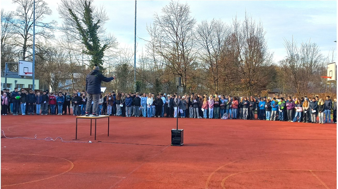
An der Hauptprobe vom Adventssingen 2025...