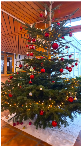
... und Weihnachtsbäume mit Bauprovisorium!