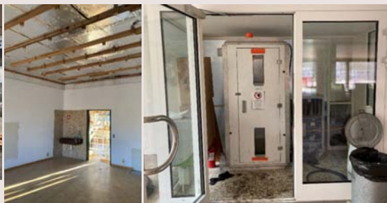
SpezKo OSZ Aarberg