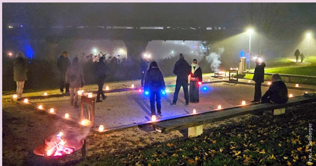
AARsenior hat im November an der Mystischen Nacht ein Pétanqueturnier für alle durchgeführt, das Alt und Jung begeisterte und viele ZuschauerInnen anzog. Nebel und Feuerschalen, Kerzenlichter und farbige Pétanquekugeln haben der Mystischen Nacht die Krone aufgesetzt.